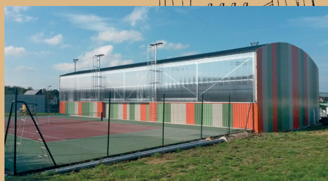
Le nouveau tennis couvert