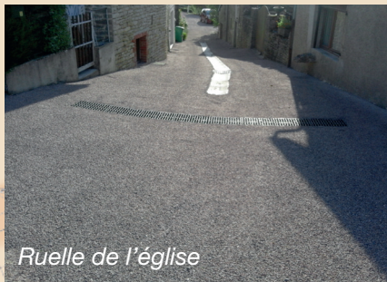
Ruelle de l'église

ZA Champ Roger : le carrefour avec la départementale étant également soumis à de fortes contraintes (freinage, démarrage et giration des poids lourds) l'application d'une grave bitume doublée d'un enrobé a été nécessaire.