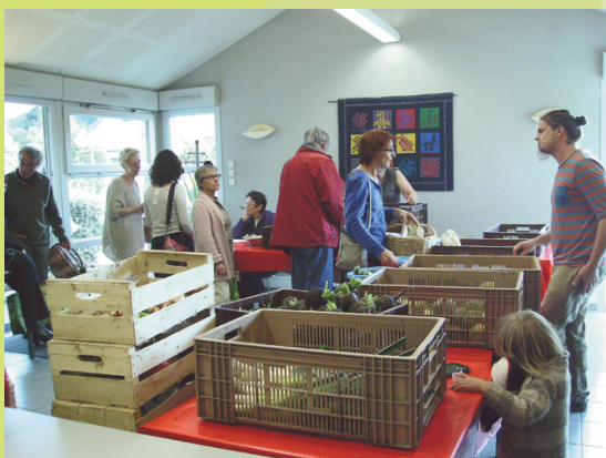
La distribution a lieu chaque Mercredi de 17h30 à 19h au Centre Social de Pouilly-en-Auxois, et elle est assurée

Vous pouvez retrouver sur le blog du Panier Pollien, un descriptif des contrats et les prix des paniers/produits proposés : http://amapplepanierpollien.overblog.com Le Panier Pollien a mis en place une application "AMAP Pouilly" qui permet de souscrire par internet à certains contrats de l'AMAPP.