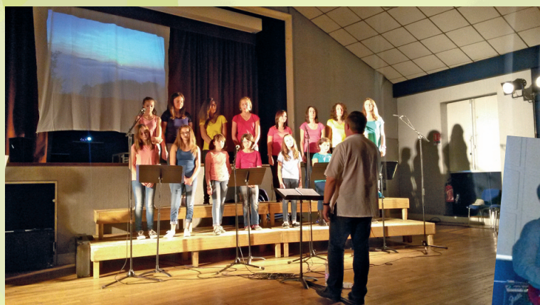
Le concert de la chorale "L'écho de la voûte"