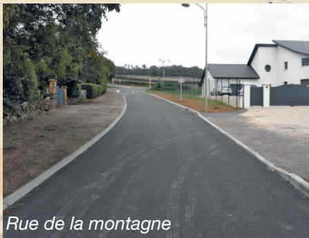
Rue de la montagne

L'aménagement de la rue de la Montagne, avec la pose de bordures, d'un caniveau grille, de grilles avaloirs. La réalisation d'une purge localisée et application d'un enrobé (béton bitumineux).