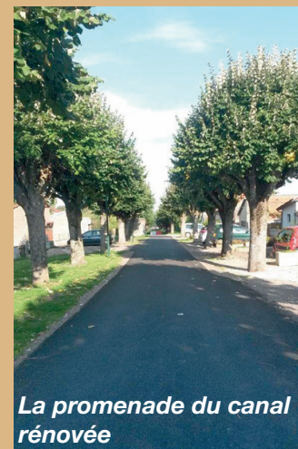
La promenade du canal rénovée

Ruelle de l'Église des caniveaux CC2, un caniveau grille, ainsi que des grilles ont été installés afin de récupérer les eaux de ruissellement. La couche de roulement a été réalisée avec un enduit bi-couche.