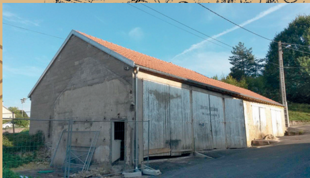
L'ancien bâtiment communal sera réaménagé pour accueillir les Restos du cœur

Ruelle de l'Église des caniveaux CC2, un caniveau grille, ainsi que des grilles ont été installés afin de récupérer les eaux de ruissellement. La couche de roulement a été réalisée avec un enduit bi-couche.