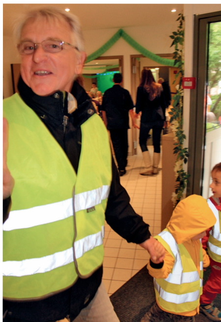
M. le Maire accompagnant les petits de la maternelle à la cantine des Myosotis, à la plus grande joie de ceux-ci.