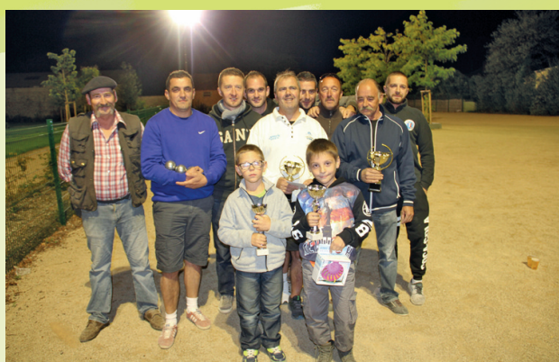
Le rallye des Hautes Côtes