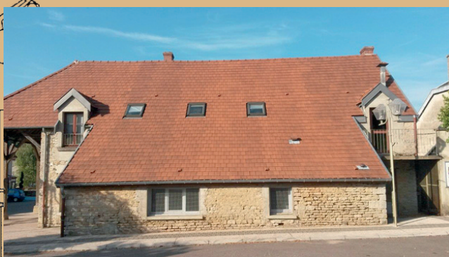
Réfection du toit de la salle informatique et de la garderie