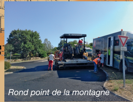
Rond point de la montagne

Le rond point de la Montagne a été purgé localement afin de reprendre les flèches. L'anneau étant soumis à de fortes contraintes, une couche de grave bitume doublée d'un enrobé a été réalisée.