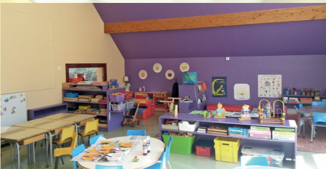
Réfection d'une classe (classe des Petits Moyens de Anne Hamelin)

Aussi, tout au cours de l'année, les élèves participent à des activités particulières qui leur permettent d'élargir leur champs de connaissances, de s'ouvrir et se confronter à d'autres enfants et adultes : la chorale de l'école les lundis à 16h00, la visite à la bibliothèque municipale les mardis matins, la visite du musée des Beaux-Arts de Dijon au printemps pour tous les élèves de Moyenne Section, les activités physiques au dojo, la participation à trois spectacles dans l'année, la journée sportive faisant se rencontrer les élèves des maternelles du canton, et d'autres sorties en fonction des projets de chaque classe.